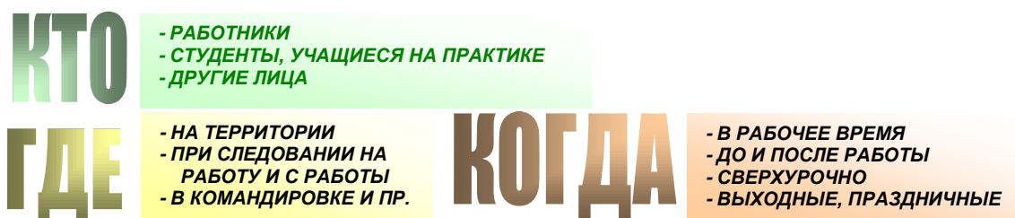
СХЕМА РАССЛЕДОВАНИЯ несчастного случая на производстве

Работодатель обязан обеспечить расследование и учет несчастных случаев на производстве в соответствии с требованиями статей 227- 231 Трудового кодекса Российской Федерации (далее – ТК РФ), приказа Минтруда России от 20.04.2022 № 223н «Об утверждении Положения об особенностях расследования несчастных случаев на производстве в отдельных отраслях и организациях, форм документов, соответствующих классификаторов, необходимых для расследования несчастных случаев на производстве».